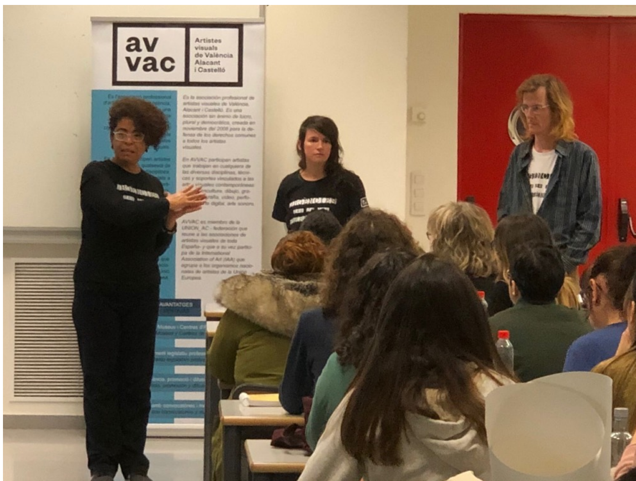
Membres de AVVAC publiciten el curs a les aules de la Facultat de Belles arts de la UPV.

16 de febrer de 2019 Grup de Coordinació de AVVAC Artistes Visals de València, Alacant i Castelló