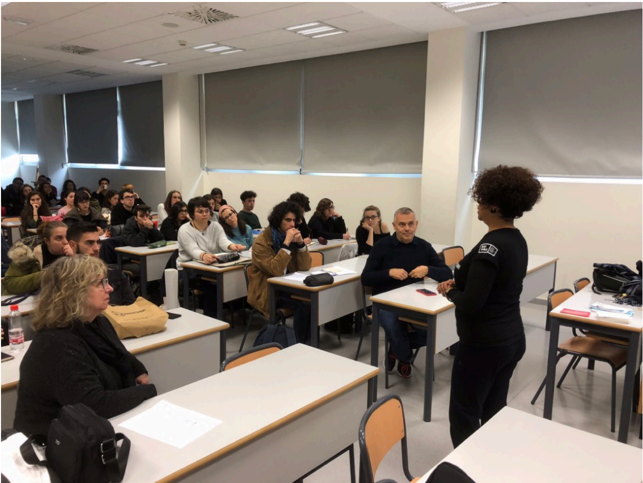
Membres de AVVAC visiten la Facultat de Belles Arts de la UPV publicitant el curs.

Artistes Visuals de València Alacant i Castellò (AVVAC - http://www.avvac.net -) pertany, al costat de la resta d'associacions d'artistes visuals de l'estat, a la Unió d'Artistes Contemporanis d'Espanya (UNIÓN_AC - https://unionac.es -) , que al seu torn és representant a Espanya de la International Association of Art (IAA - http://www.aiap-iaa.org/ -) .